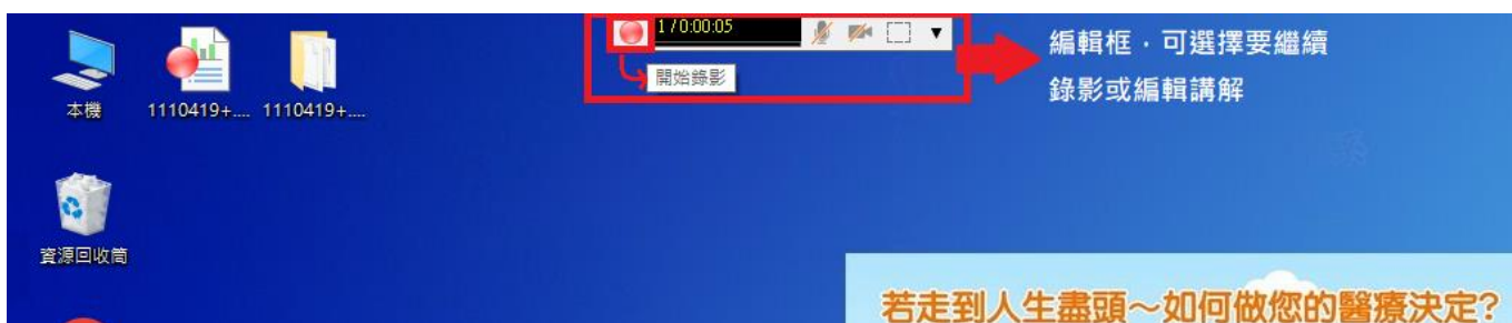
圖四：需要直接在原檔接續錄製，按紅色圓形開始錄影