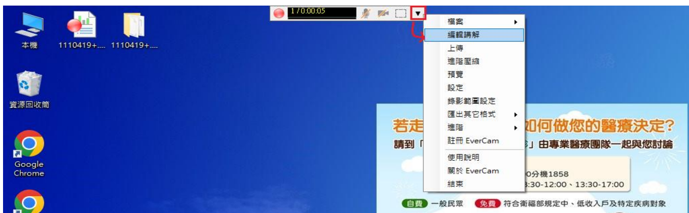
圖五：點選倒三角型進入編輯講解