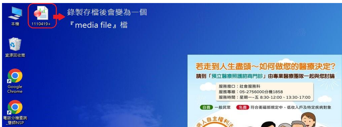
圖一：Evercam9 錄製完成後會變為一個 media file 檔