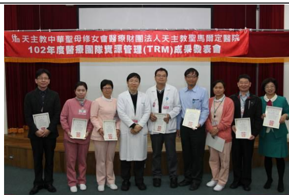
頒發海報展感謝狀