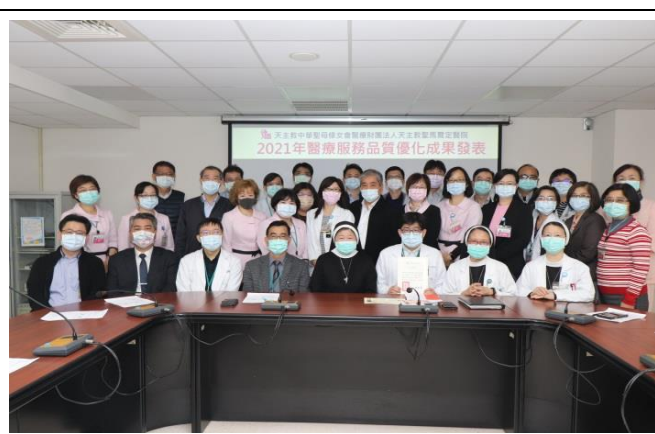
2021年醫療服務品質優化成果發表大合照及響應病安週活動