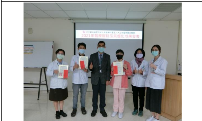
單位投稿件數最多