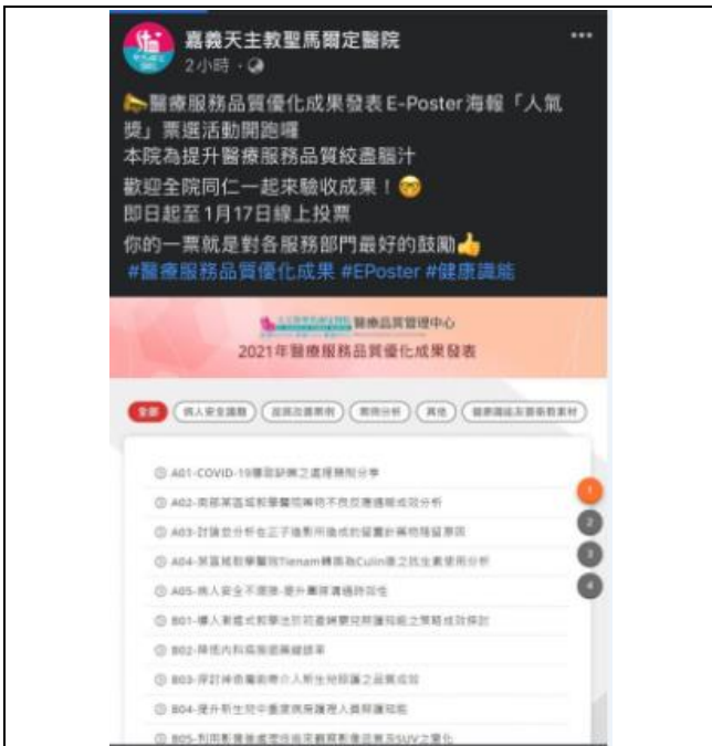
公告聖馬 Facebook 訊息