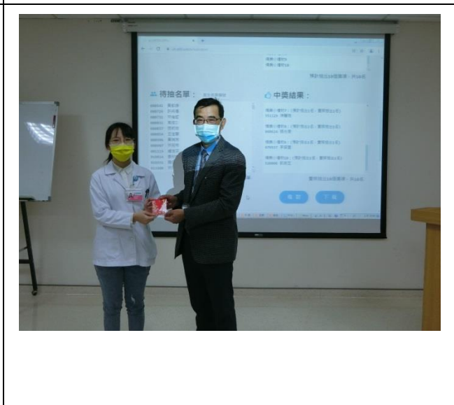
隨機抽籤人氣獎票選活動院內同仁代表領獎