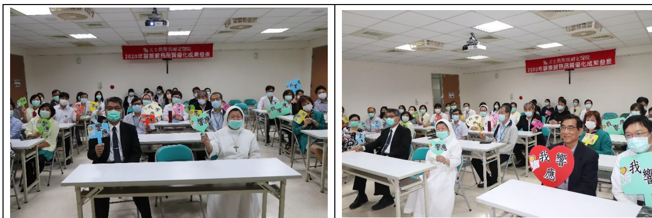
2020 年醫療服務品質優化成果發表大合照及響應病安週活動