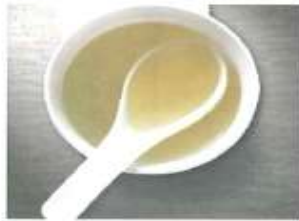
無渣湯汁(葷素皆可)