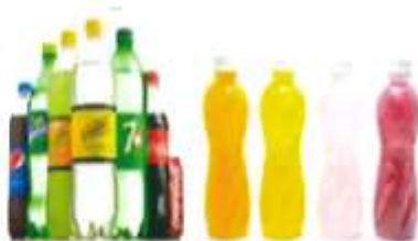
無渣飲料/無渣果汁