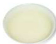
粥湯/肉湯/魚湯/菜湯