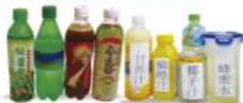
無渣飲料/無渣果汁