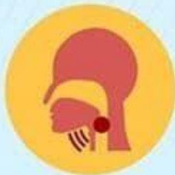
Sindrom pernapasan akut