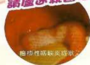
疱疹性咽峽炎症狀