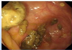
解出混濁液態糞便