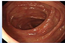
解出黃色清澈液體